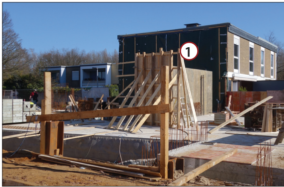
Das Haus wächst in die Höhe. Rechts neben der ersten Wandverschalung liegt der Pfarrbürotrakt, links der Wand die Küche.