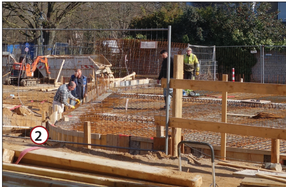
Handarbeit an der nördlichen Außenmauer. Die Lage des Hauses ist gut zu erkennen. Unten der Eingang zur Küche von Norden.