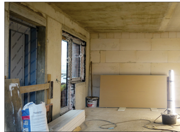
links der Aufzug neben dem Ausgang