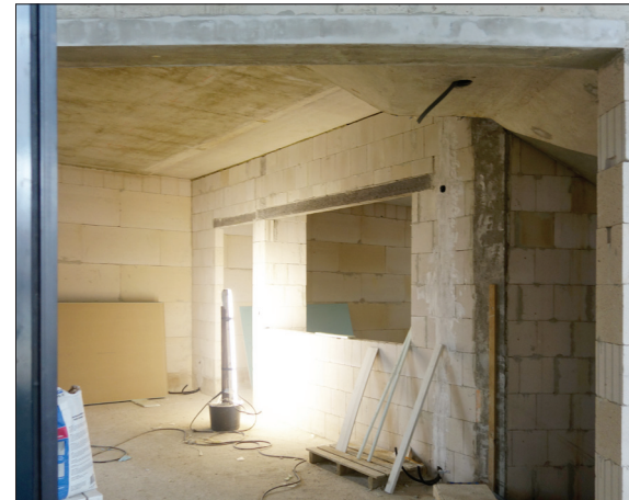
rechts Tür und Fenster zur Küche und selbst im Keller ist Licht

Von außen unübersehbar: Die Dachdecker dichten das Dach ab. Die Verklein- erung ist schon weit fortgeschrit- ten, besonders an den Rundungen erkennt man die große Sorgfalt. Der Innenausbau geht voran. Elek- triker und Install- ateure bearbeiten ihre Gewerke. Unsere Vorfreude wächst!