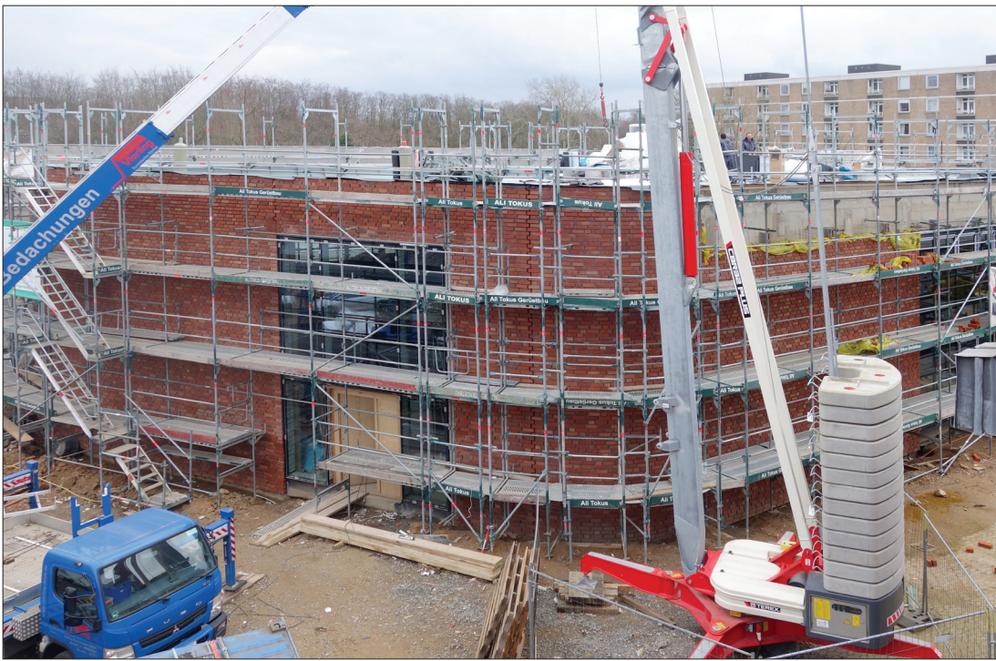
Vom Dach bis in den Keller... überall wird gearbeitet